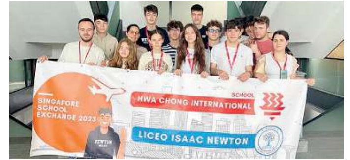
Internazionale. Il Newton offre anche scambi culturali con Singapore