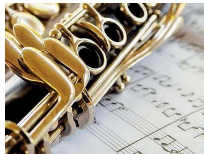
In musica. C'è anche il Liceo musicale e coreutico