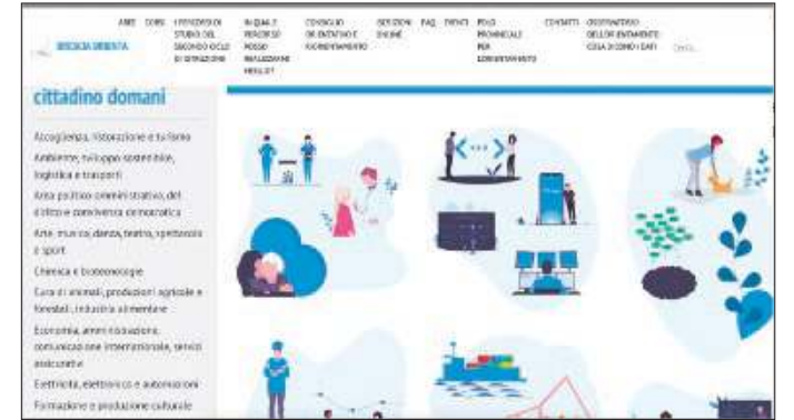
Il portale. Una schermata di www.bresciaorienta.it