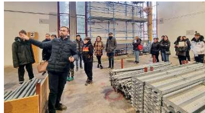
Una formazione completa. La scuola unisce teoria e tanta pratica