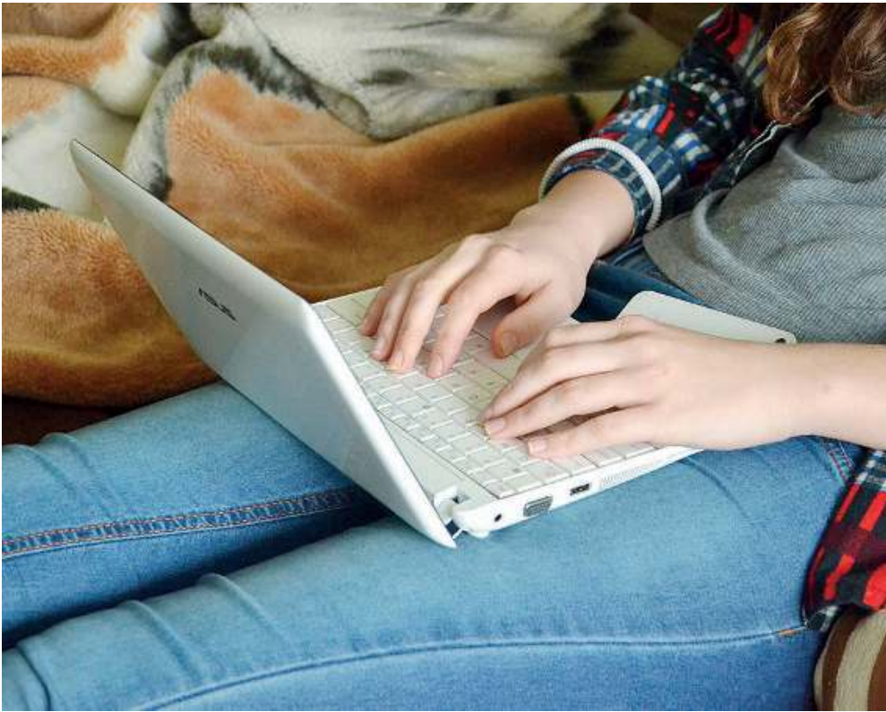
Una scelta importante. Per aiutare gli studenti e le loro famiglie ci sono molte forze concordi in campo