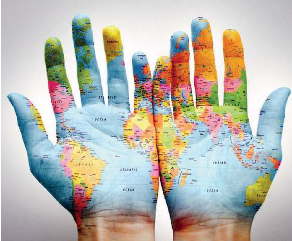
Comprendere la complessità. L'opzione economico sociale rientra nel liceo delle Scienze umane