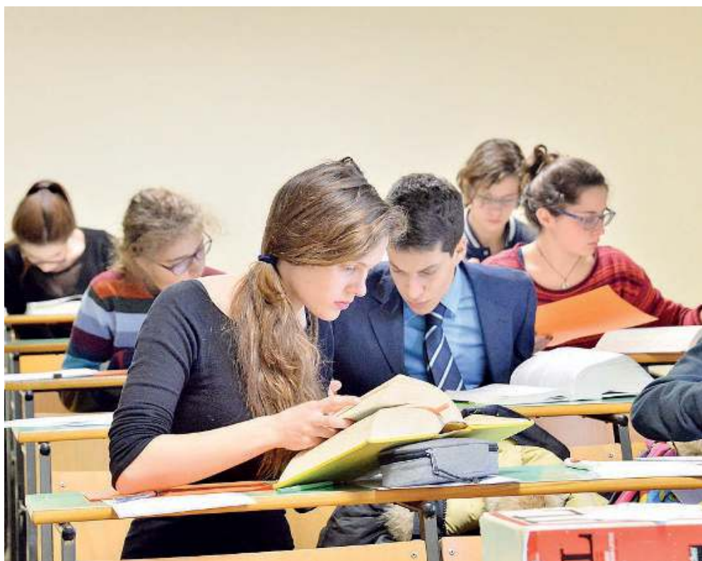
Passione antichità. Due studenti alle prese con una gara di traduzione dal latino